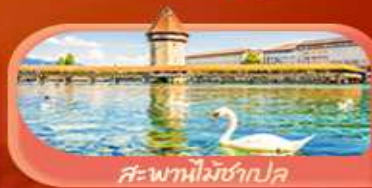
สะพานไมซ์ฮักปด

Highlight เยือนหมู่บ้านแสนสวยเซอร์แมท เช็กอินศาลาไทยสุดงามที่โลซาน เที่ยวลูเซิร์น ชมสะพานไม้ชาเปลและอนุสาวรีย์สิงโต ซาลี แอปสทิน ชมประติมากรรม The Fork และปราสาทซิลลองริมทะเลสาบ เยือนมิลาน มหาวิหารดูโอโม เที่ยวเวนิส เมืองลอยน้ำสุดโรแมนติก อินกับรักอมตะที่บ้านจูเลียต และช้อปปิ้งจุใจที่ Serravalle Outlet