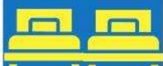
ห้องพักเตียงคู่ TWIN