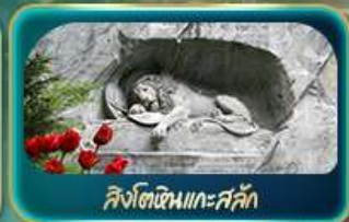
สิงโตหินแกะสลัก