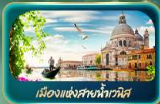
เมืองแห่งสายน้ำเวนิส

จุดบรรจบความอลังการของธรรมชาติ Dolomites และ ทะเลสาบมิซูร์น่า ชมน้ำสีเทอร์ควอยซ์ ทะเลสาบเบรียส สุดโรแมนติกเมืองแห่งสายน้ำเวนิส ห้ามพลาด มหาวิหารดูโอโมแห่งมิลาน โรมัน ฮาร์น่า บ้านของจูเลียต เที่ยวลูเซิร์น ชมสิงโตหินแกะสลัก เดินเล่นสะพานไมซ์าเปลา อินส์บรุค ย้อนอดีตกับเฮาเซนด็อนน์ หลังคาทองคำ ช้อปปิ้ง Outlet