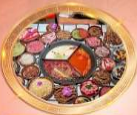
บุฟเฟต์หม้อไฟลงซิ่ง