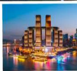
ตึกรูปเฟี๊