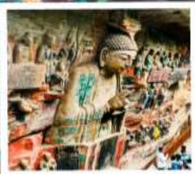
พาหิณแกะสลักต้าจู้