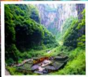
หลุมฟ้าสะพานสวรรค์