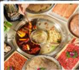
หม้อไฟหมาล่า