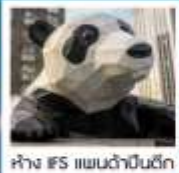
ห้าง IFS แพนด้าปิ่นตึก