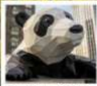
ห้าง IFS แพนด้าปิ่นตึก