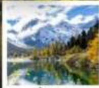
ปี้เพิงโกว