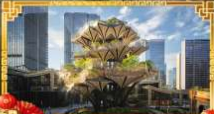
XIAN TREE&MIXC MALL