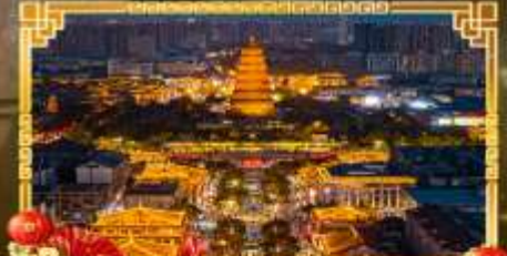
ถนนคนเดินราชวงศ์ถัง