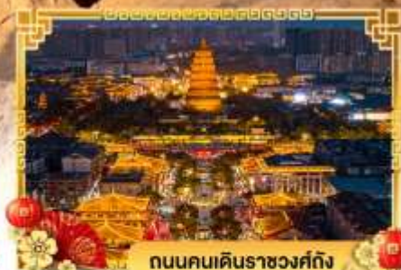
ถนนคนเดินราชวงศ์ถัง