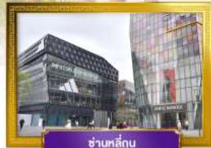
ชานหลู่กุน