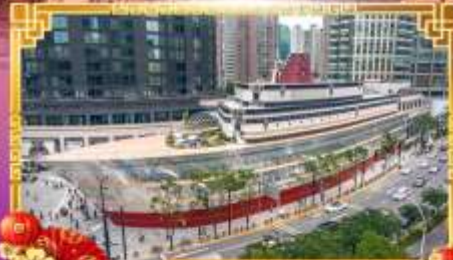
เรือหลุยส์วิคตอง