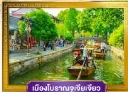
เมืองโบราณซูโจว