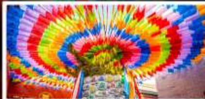
วัดลามะกว้างเหิน