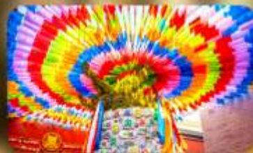
วัดลามะกว้างเหริน