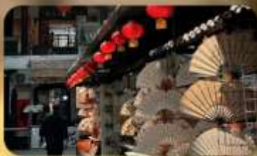
ถนนโบราณซูหยวนเหมิน