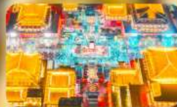
ถนนวัฒนธรรมต้าถิง