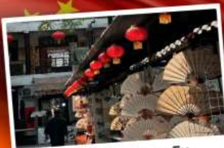
ถนนโบราณซูหยวนเหมิน

"มรดกโลกพันปี สุสานทหารดินเผา" แต่งชุดจีนโบราณ เดินถนนวัฒนธรรมต้าถิง