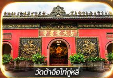
วัดต้าจื่อไท่กุหลี่