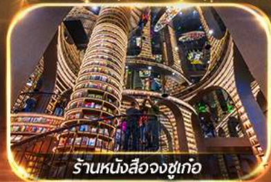
ร้านหนังสือจางซูเก้อ

เที่ยวชมทัศนียภาพ 2 อุทยาน บีเฟิงโก & ชวงเจียวโก