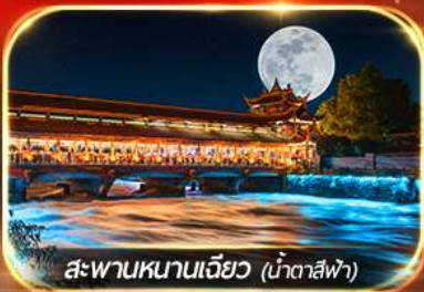
สะพานหนานเจียว (น้ำตาสีฟ้า)