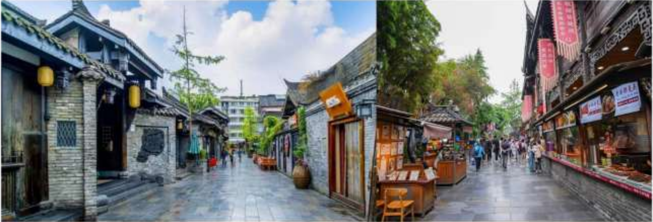
กลางวัน รับประทานอาหาร ณ ภัตตาคาร

จากนั้นนำท่านสู่ ถนนชอยกว้าง-ชอยแคบ ย่านโบราณที่มีประวัติยาวนานตั้งแต่สมัยราชวงศ์ซิง โดดเด่นด้วยสถาปัตยกรรมจีนโบราณผสมผสานความทันสมัยของร้านค้ายา คาเฟ่ และร้านอาหารท้องถิ่นมากมาย อิสระให้ท่านเดินเล่น ชิมขนมพื้นเมือง เลือกซื้อของฝาก และถ่ายภาพกับมุมสวย ๆ