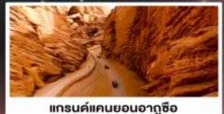
แกรนด์แคนยอนอาถูซื่อ