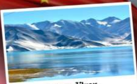
ทะเลสาบไปซาหู

เปิดประตูสู่อารยธรรมพันปีแห่งซินเจียงใต้ ชมความสวยงามของหมู่บ้านดอกแอปเปิ้ล