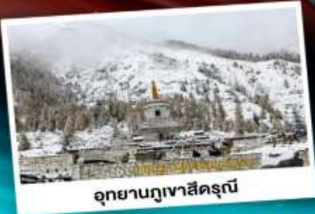
อุทยานกุเวาสีดรุณี