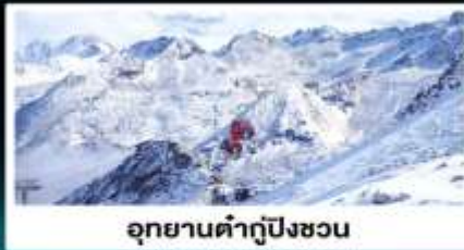
อุทยานคำกู่ปิงซอน