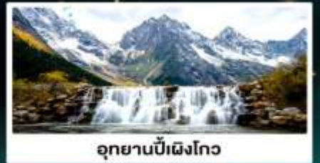
อุทยานปี้เฉิงโกว