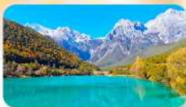
ทะเลสาบไป๋สุยเหอ