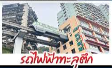
รถไฟฟ้าทะลุติค