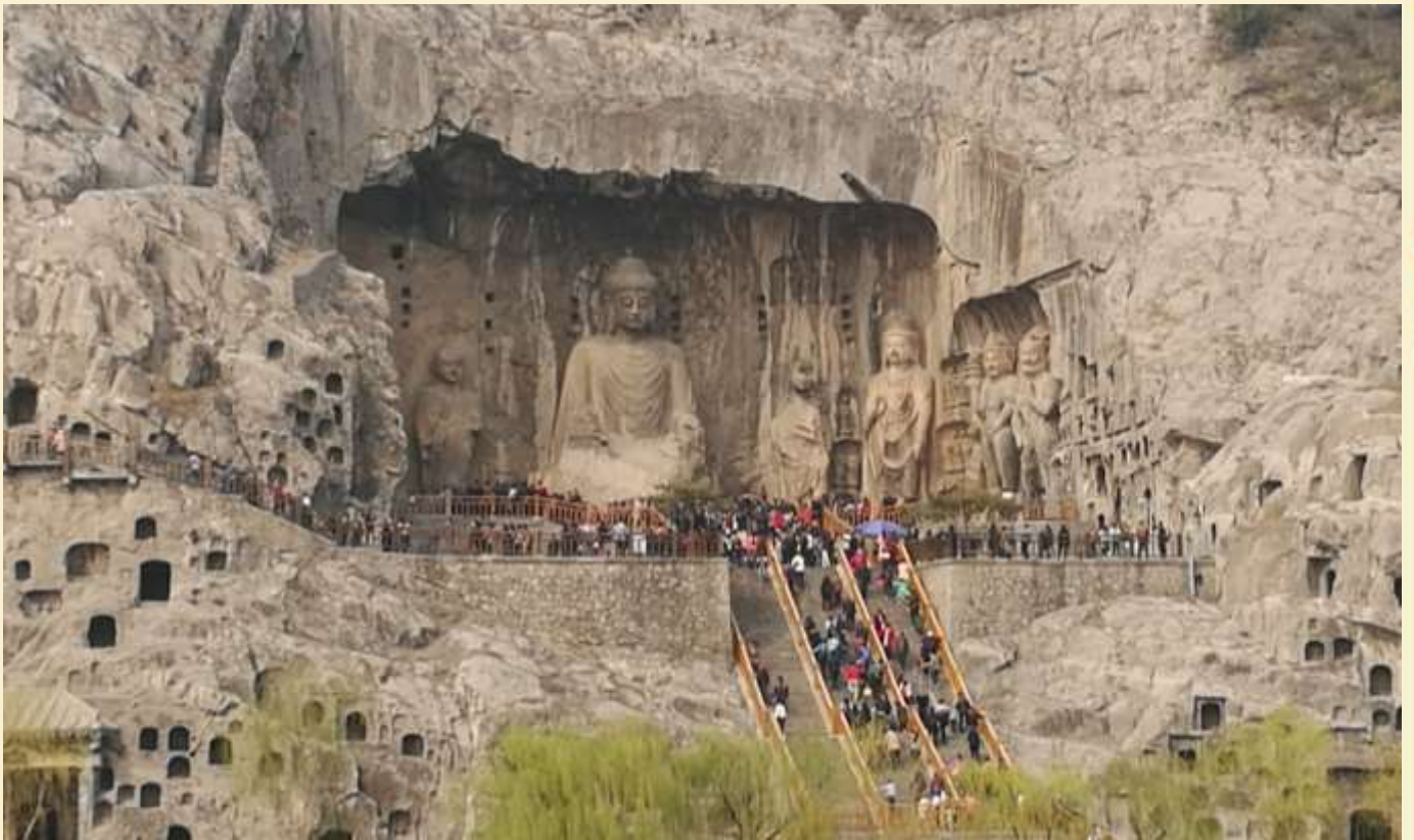
มีพระประธานสูง 17 เมตรสลักอยู่กลางถ้ำรายล้อมด้วยพระโพธิสัตว์และทวยเทพ

บาล รวมถึงการเขียนภาพจิตรกรรมลงบนผนังถ้ำ .....ปัจจุบันยูเนสโกประกาศให้หลงเหมินเป็นมรดกโลกทางวัฒนธรรมในปี ค.ศ. 2000 นำท่านชมถ้ำเฟิ่งเซียนชื่อ ซึ่งเป็นจุดไฮไลต์ ภายในถ้ำ