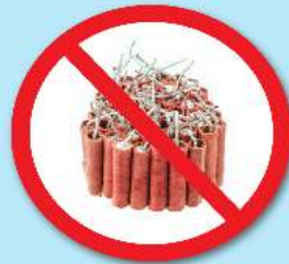
พลุ, ประทัด