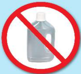
ขวดน้ำยา