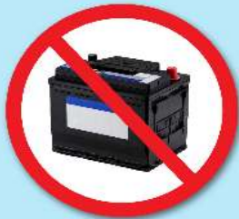
แบตเตอรี่ดำ