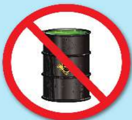
สารกัมมันตรังสี