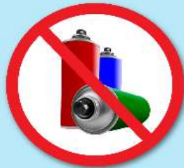
ขวดสเปรย์