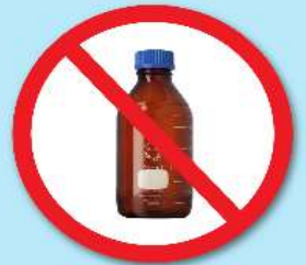
ขวดสารเคมี