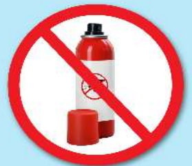
ขวดน้ำยา ฆ่าแมลง