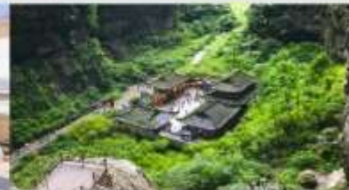
อุทยานแห่งชาติบ่อหลุมฟ้า

*ทางบริษัทฯ ขอสงวนสิทธิ์ในการล้บโปรแกรมทัวร์ตามความเหมาะสมขึ้นอยู่กับสถานการณ์หน้างาน โดยค่านั่งถึงผลประโยชน์ของลูกค้เป็นสำคัญ