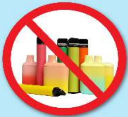
ปืนไฟฟ้า บุหรีไฟฟ้า