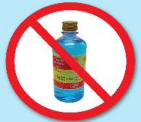
ขวดแอลกอฮอล์