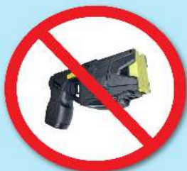
ปืนซ็อตไฟฟ้า