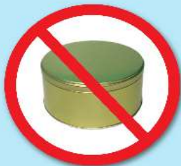
กล่องโลหะ