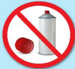
กระป๋องสเปรย์