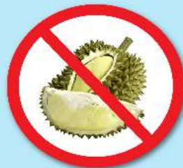
ผลไม้เขตร้อน ที่มีหนาม