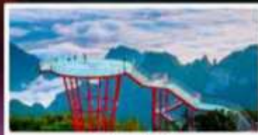
กุเวา 7 ดาว