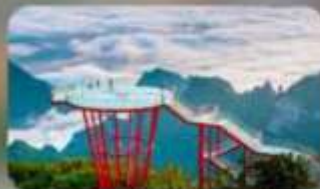
กุหลาบ 7 ดาว