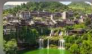
หมู่บ้านโบราณฟุทรงเจิน