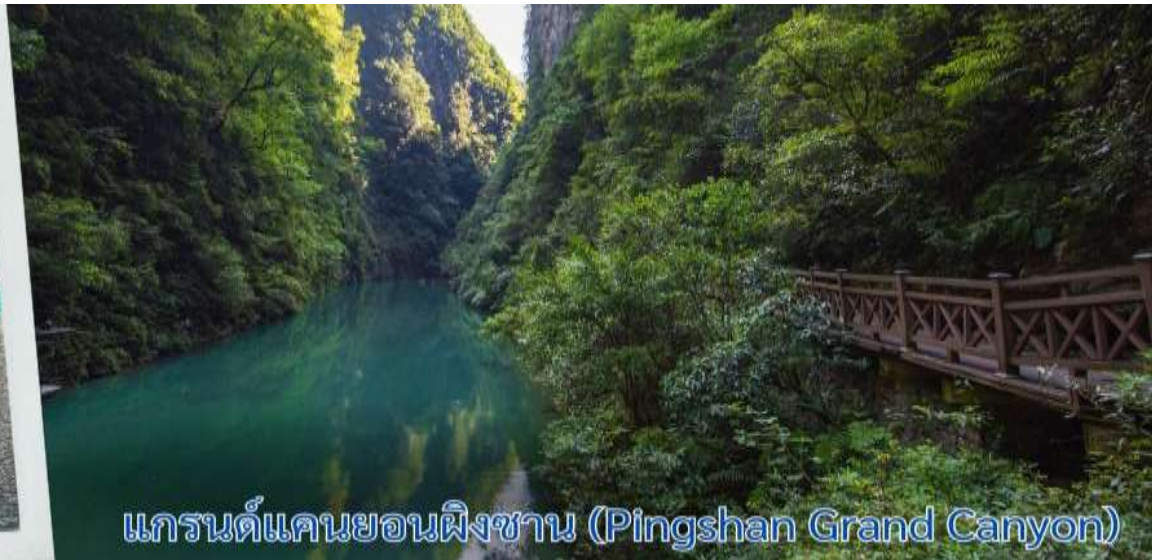
แกรนด์แคนยอนผิงซาน (Pingshan Grand Canyon)