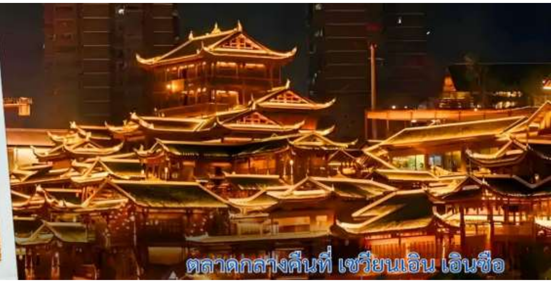
ตลาดกลางคืนที่ เซวียนเอน เอินซือ