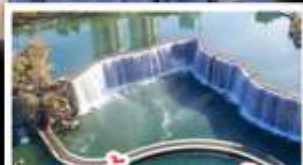
สวนน้ำตกคุณมิ่ง