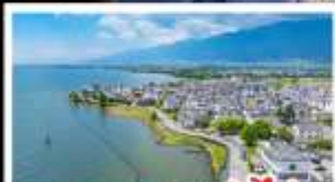
ทะเลสาบเอ๋อไห่