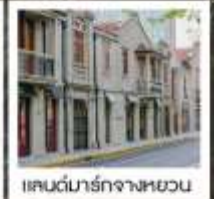
แลนด์มาร์กจางหยวน

เซี่ยงไฮ้ คาสสิก ไนท์ / 3 ดึกใหญ่แห่งเซี่ยงไฮ้ คองเรือหมู่บ้านโบราณจูเจียเจียว / EKA Tianwu / วัดหลงหัว แลนด์มาร์ก จางหยวน / ถนนหวยไห่ / ชมโชว์ ERA ที่โรงละครโด่งดังระดับโลก / ซินเทียนตี้