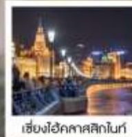
เซี่ยงไฮ้คาสสิกไนท์