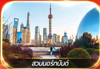
สวนนอร์มันด์