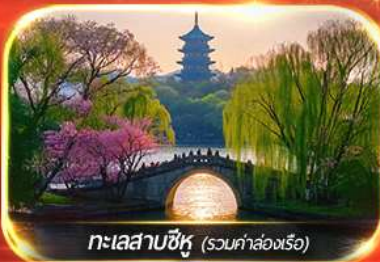
ทะเลสาบซีหู (รวมค่าล่องเรือ)