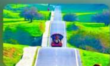
เขานางฟ้า