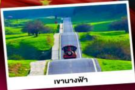
เขานางฟ้า