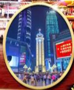
ถนนคนเดินเจียฟางเป่ย์