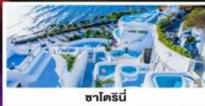
ซาโตรนี่