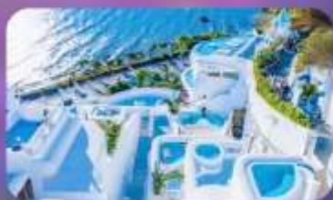
ซาโตรี่นี่