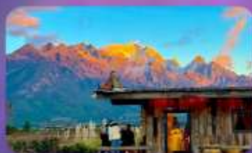
คาเฟ่ Yun Ti Yang