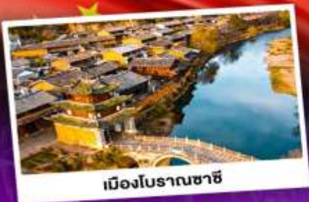
เมืองโบราณซาซี

ชมดอกไม้บานสะพรั่งทั่วยูนนาน "เซ็ดอี่แฉาเฟ่วิวส์ดอกคิง"