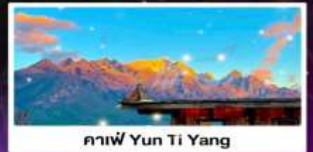
กาแฟ Yun Ti Yang