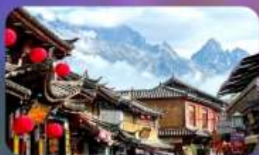
เมืองโบราณซาซี