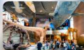
พิพิธภัณฑ์เซี่ยงไฮ้