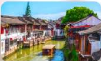
เมืองโบราณจูเจียวเจียว