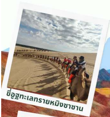
ขี่อูฐทะเลทรายหมิงซาซาน