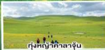
ทุ่งหญ้าคาลาจูน