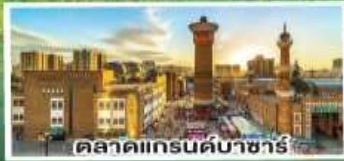
ตลาดแกรนด์บาซาร์