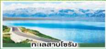
ทะเลสาบไซริม