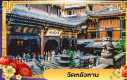
วัดหลัวหนาน