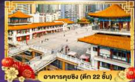
อาคารคุยซิง (ตึก 22 ชั้น)