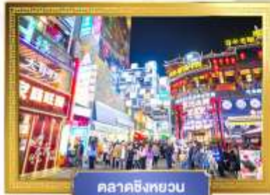
ตลาดชิงหยวน