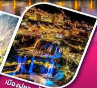
เมืองฝูหลงจีน