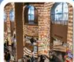
"ห้องสมุดจงซูเก๋"