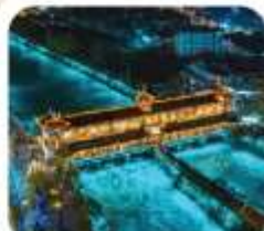
"สะพานหมานเจียว"