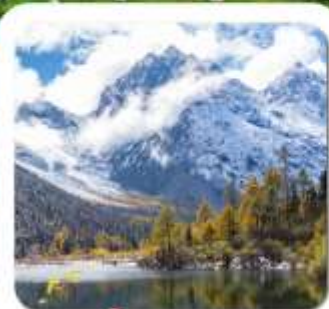
"ปี้เผิงโกว"

ชมความงาม 2 อุทยาน • สี่ฤดูนี้ ของเฉียวโกว • ปี้เผิงโกว • พระใหญ่เล่อซาน สะพานหมานเจียว น้ำตาสีฟ้า • ห้องสมุดสุดเก๋ จงซูเก๋ • แพนด้ายักษ์บนจอมเขาสี ชอยกัววังชอยแคม • ถนนคนเดินซุนซีสู๋ • แพนด้ายักษ์ปีนดึก • ถนนคนเดินจินหลี่