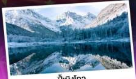
ปี้ฝิงโกว

เทือกเขาแอลป์เมืองจีน "ภูเขาซีครุนี" ชมความสวยงามของอุทยานปี้ฝิงโกว