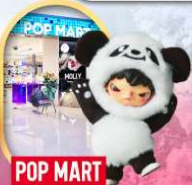
ช้อปปิ้งร้าน Pop Mart