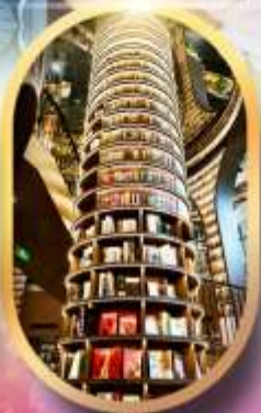
หอหนังสือจ้งซูเก้อ