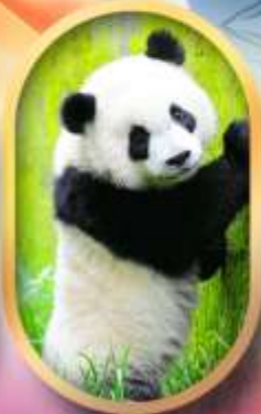
ศูนย์อนุรักษ์หนิแพนด้า