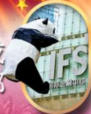
IFS หนิแพนด้าป็นดัก