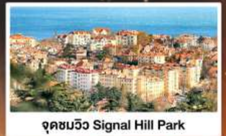
จุดชมวิว Signal Hill Park