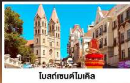
โบสถ์เซนต์ไมเคิล