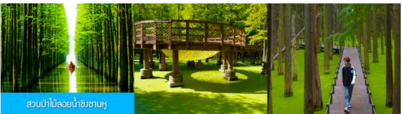
สวนป่าไผ่ลอยน้ำชิงซานหู

พักที่ PAIJING HOLIDAY HOTEL โรงแรมระดับ 4 ดาวท้องถิ่น หรือเทียบเท่า เมืองหวงซาน