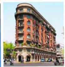
ถนนอู๋คิง