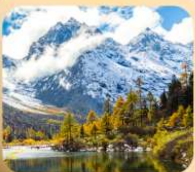
“ปี่เฟิงโกว”

ชมธรรมชาติ 2 อุทยานขึ้นชื่อ อุทยานภูเขาสี่ดรุณี + อุทยานปี่เฟิงโกว สะพานหนานเฉียว • ถนนคนเดินไถ่กู่หลี่ + ซุนซีลู่ + Pop Mart • ดงเจียวจื่อ