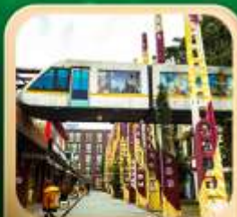
“ดงเจียวจื่อ”