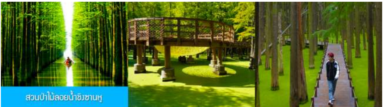
สวนป่าไม้ลอยน้ำชิงซานหู

หลังอาหารเช้าท่านเดินทางโดยรถบัสสู่เมืองหลิงอัน 临安市 (ระยะทาง 175 กม. ใช้เวลาเดินทางราว 2 ชั่วโมงเศษ)