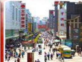
ช้อปปิ้งถนนคนเดินซุนซีลู่