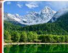
อุทยานπίงโกว