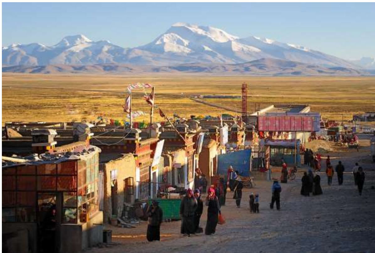
ที่พัก Dharchen Himalaya hotel