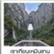
เซาเทียนเหมินซาน

ฉลองเที่ยวบินปฐมฤกษ์ เก็บครบทุกไฮไลต์!! วันที่ 10 พฤษภาคม 2569 กรุงเทพฯ - ดางซา (จางเจียเจีย)