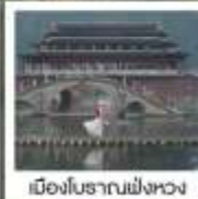
เมืองโบราณฟังหวง