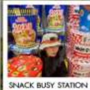
SNACK BUSY STATION