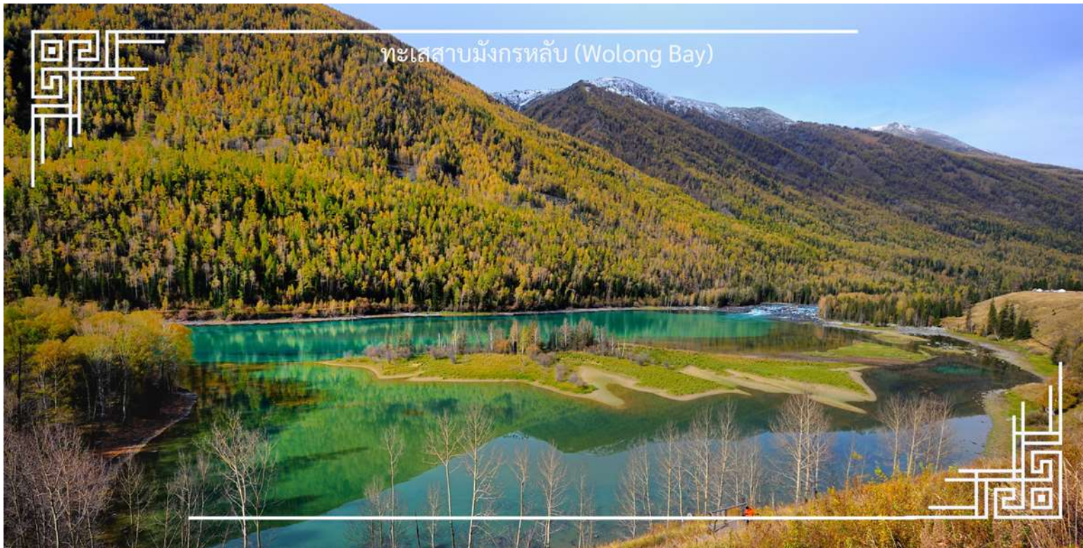
ทะเลสาบมังกรหลับ (Wolong Bay)

จากนั้นนำท่านชม ทะเลสาบเทวดา (Fairy Bay) จุดชมวิวยุคใหม่ที่ตั้งอยู่ทางตอนใต้ของทะเลสาบคานาสีอ ภายในเขตโดดเด่นด้วยผืนน้ำใสสะท้อนเงาภูเขาและผืนป่า สร้างบรรยากาศราวดินแดนในเทพนิยาย สถานที่แห่งนี้มีชื่อเรียกตามตำนานท้องถิ่นว่า “อ่าวของเหล่าเซียน” โดยเล่าขานกันว่าเป็นสถานที่ที่เหล่าเทพเซียนลงมาเล่นน้ำ จึงยังเพิ่มเสน่ห์และความลึกลับให้กับทัศนียภาพอันงดงาม