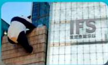
ถนนคนเดินซุนซีลู่