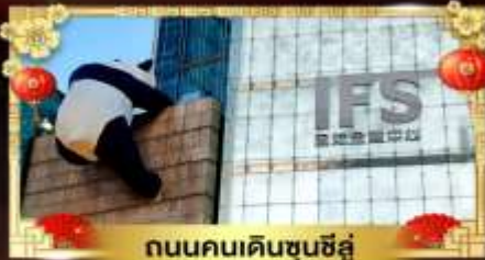
ถนนคนเดินชุนชี่อู๋

เที่ยวอุทยานสวรรค์ระดับ 5A จิวจ้ายโกว "กู๋เขาสีดรุณี" อุทยานชื่อดังเหนียงชาน