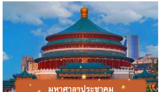
มหาศาลาประชาชน