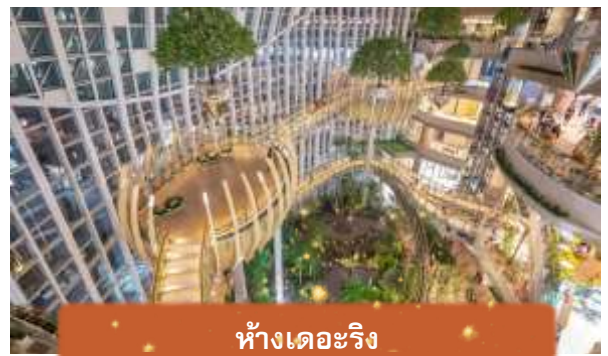
ห้างเดอะริง

คำ อิสระอาหารค่ำเพื่อความสะดวกในการท่องเที่ยว