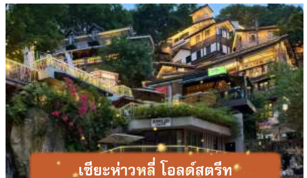
เขียะท่าวหลี่ โอลด์สตรีท

ค่า อีสรอาหารค่ำเพื่อความสะดวกในการท่องเที่ยว ที่พัก HOLIDAY INN EXPRESS HOTEL เทียบเท่าหรือระดับ 4 ดาวท้องถิ่น