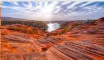
อุทยานหุบเขาคีลิน

*ทางบริษัทฯ ขอสงวนสิทธิ์ในการสลับโปรแกรมทัวร์ตามความเหมาะสมขึ้นอยู่กับสถานการณ์ทำงาน โดยค่าใช้จ่ายผลประโยชน์ของลูกค้าเป็นสำคัญ