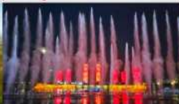
น้ำพุคังปาซือ