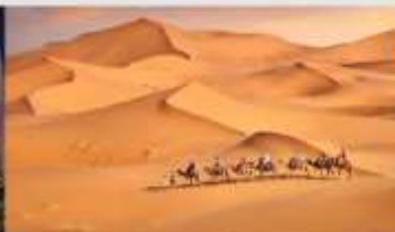
ทะเลทรายเสียงชวาม