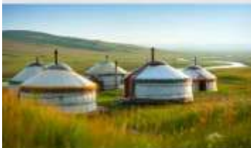
ทุ่งหน้าออร์ดอส