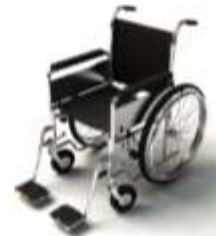
การรับการดูแลเป็นพิเศษ

กรณีผู้เดินทางต้องการความช่วยเหลือเป็นพิเศษ อาทิเช่น การใช้วีลแชร์ กรุณาแจ้งบริษัทฯ อย่างน้อย 7 วันก่อนการเดินทาง มิฉะนั้นบริษัทฯ จะไม่สามารถจัดการล่วงหน้าได้ เนื่องจากการขอใช้วีลแชร์ในสนามบินนั้น ต้องมีขั้นตอนในการขอล่วงหน้า และบางสายการบินอาจมีการเรียกเก็บค่าใช้จ่ายทั้งทางสนามบินในไทยและในต่างประเทศ ซึ่งผู้เดินทางสามารถสอบถามกับเจ้าหน้าที่ได้โดยตรงก่อนทำการจอง และหากในขณะของท่านมีผู้ต้องการดูแลพิเศษ เช่น ผู้ที่นั่งรถเข็น (Wheelchair), เด็ก, ผู้สูงอายุและผู้ที่มีโรคประจำตัวหรือไม่สะดวกในการเดินทางท่องเที่ยวในระยะเวลาเกินกว่า 4 - 5 ชั่วโมงติดต่อกัน ท่านและครอบครัวต้องให้การดูแลสมาชิกภายในครอบครัวของท่านเอง เนื่องจากการเดินทางเป็นหมู่คณะ หัวหน้าทัวร์มีความจำเป็นต้องดูแลคณะทัวร์ทั้งหมด