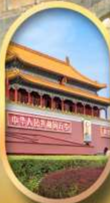
จัสมุรีสเทียนอันเหมิน