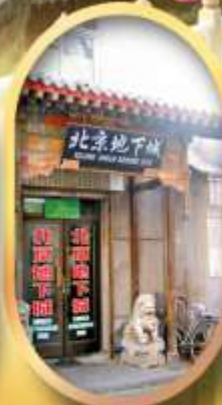
เมืองโบราณใต้ดิน