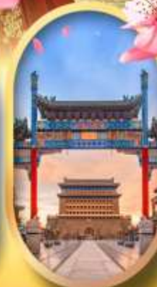
ถนนคนเดินเจียมเหมิน