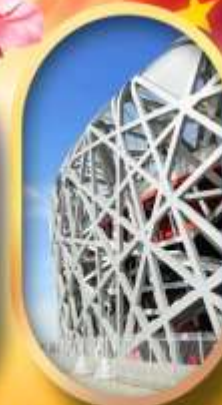
ผ่านชมสนามกีฬาโอลิมปิก