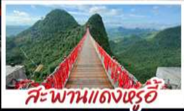
สะพานแดงหรูอี้