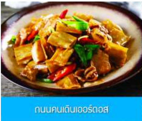
ถนนคนเดินเออร์คอส

จากนั้นนำท่านเที่ยวชม อุทยานคังปาสิอ 康巴什景区 เป็นเขตเมืองใหม่ที่ถูกเนรมิตรขึ้นและได้รับการขึ้นทะเบียนเป็นอุทยานท่องเที่ยวระดับ 4A และเป็นศูนย์กลางความเจริญของเมืองเออร์คอส ประกอบด้วยจัตุรัส ซิมปาร์ค พิพิธภัณฑ์ แกรนด์เธียร์เตอร์ ศูนย์วัฒนธรรม และสนามแข่งรถนานาชาติ นำท่านนั่งรถผ่านชมจัตุรัสรัฐบาล ทะเลสาบอุหลันมู่ สวนศิลปะงานปาติมากรรมเอเชีย ฯลฯ