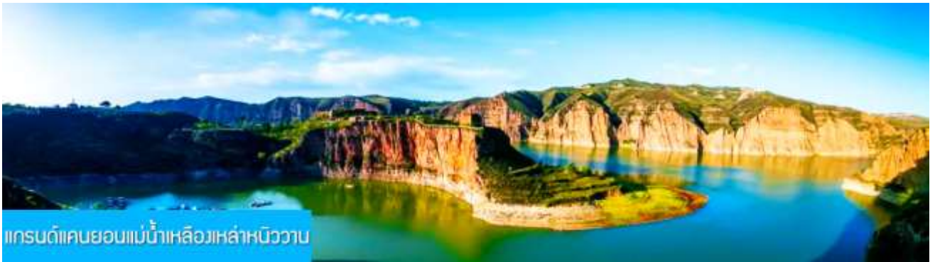
แกรนด์แคนยอนแม่น้ำเหลืองเหล่าหนิววาน

พักที่ DALATEQI SHNAGJING HOTEL โรงแรมระดับ 4 ดาวหรือเทียบเท่าในเมืองต้าลาเท่อ