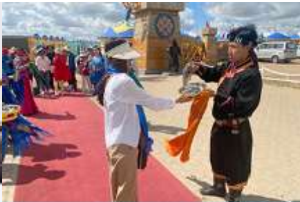
พิธีต้อนรับแขกด้วยเหล้า