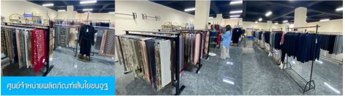
ศูนย์จำหน่ายผลิตภัณฑ์เส้นใยขนอูฐ