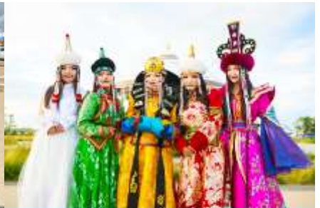
แต่งชุดพื้นเมืองมองโกล