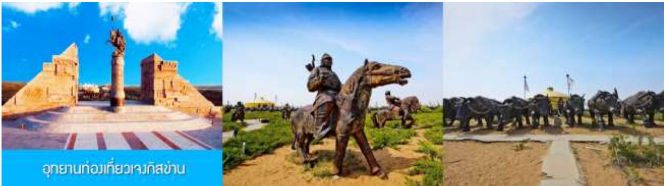
อุทยานท่องเที่ยวเวงกิสข่าน

รับประทานอาหารกลางวัน ณ ร้านอาหารพื้นเมืองในเขตอุทยาน (11)