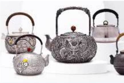
พิพิธภัณฑน์เครื่องเงินมองโกล