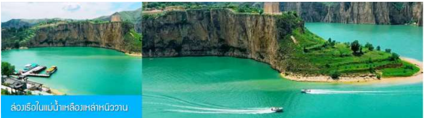
ล่องเรือใบแม่น้ำเหลืองเหล่าหนิววาน

เที่ยง รับประทานอาหารกลางวัน ณ ร้านอาหารระหว่างทาง (8)