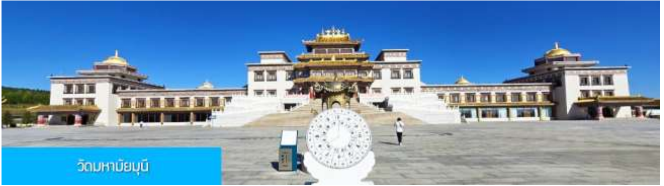
วัดมหาเมฆมณี