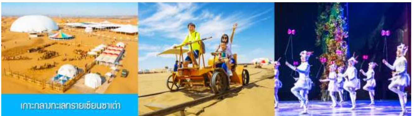
เกาะกลางทะเลทรายเขียนซาเต่า