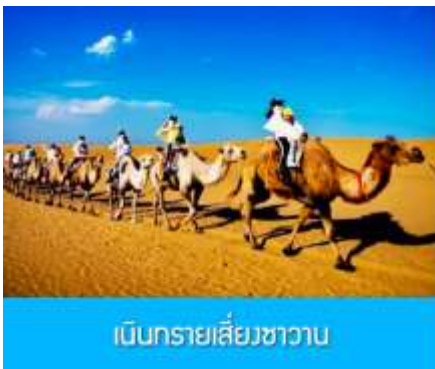
เนินทรายเสียงซาวาน