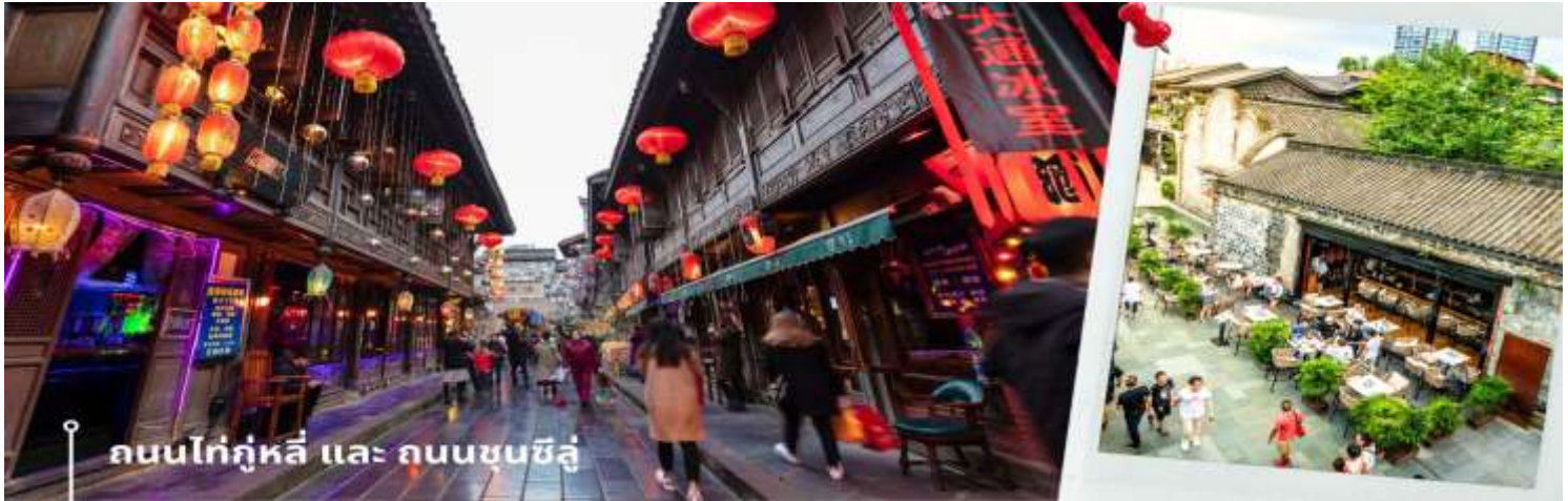
ถนนไถ่กุ่หลี่ และ ถนนชุนซีลู่

จากนั้นให้ท่านให้อิสระกับการเลือกซื้อสินค้าของฝากที่ ถนนไถ่กุ่หลี่ และ ถนนชุนซีลู่ ในย่านนี้เป็นถนนโบราณ ในอดีตเคยโรงงานผลิตผ้าไหมใหญ่ที่สุดในจีน ปัจจุบันได้เปลี่ยนเป็นถนนช้อปปิ้งแหล่งสวรรค์ของนักท่องเที่ยว เป็นถนนคนเดินมีห้างสรรพสินค้าชื่อดัง มีร้านค้ามากกว่า 700 ร้านค้าที่เต็มไปด้วยสินค้าต่าง ๆ ทั้งร้านค้าแฟชั่น ร้านอาหาร และโรงแรมนานาชาติมากมายซึ่งเป็นที่เที่ยวเชิงดูที่มีการเชื่อมต่อทางวัฒนธรรมท้องถิ่นที่เป็นแหล่งช้อปปิ้งและเป็นแหล่งร้านอาหารที่อร่อยต่าง ๆ มากมาย ซึ่งเป็นสถานที่เที่ยวของเชิงดูที่ทำให้เพลิดเพลินกับสินค้าแบรนด์เนมและแบรนด์จีน เพื่อให้นักท่องเที่ยวได้เลือกซื้อตามอิสระ