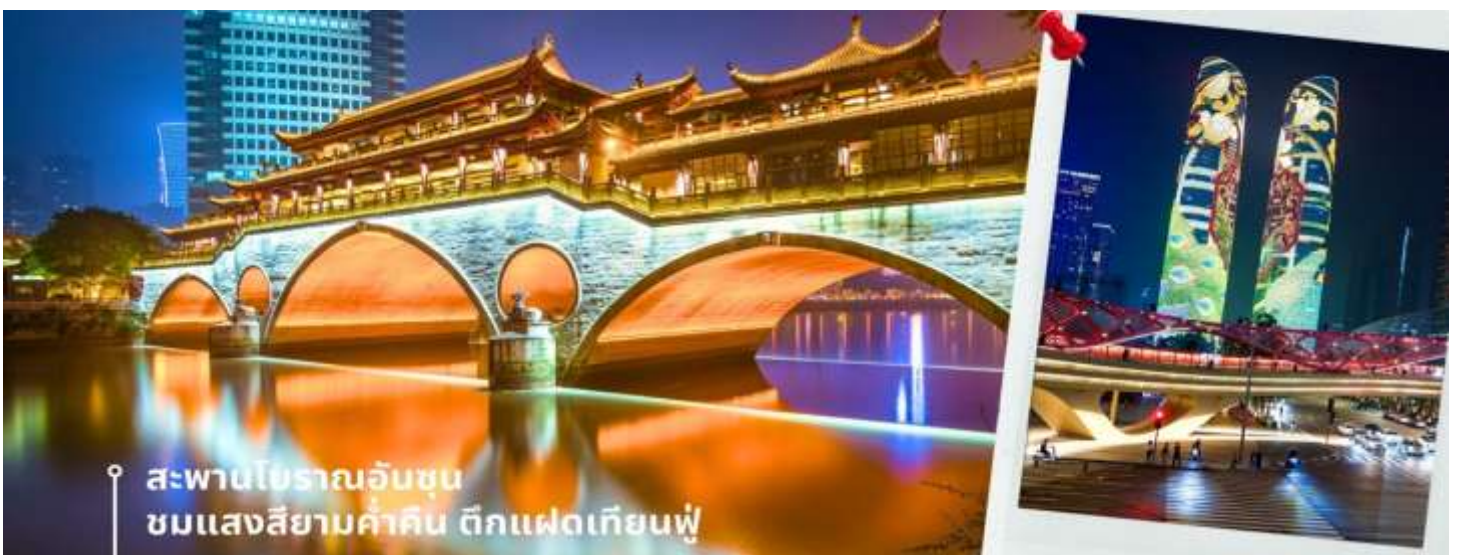
สะพานโบราณอันชุน ชมแสงสียามค่ำคิน ตึกแฝดเทียนฟู

➔ นำท่านเดินทางเข้าที่พัก AC HTL MARRIOTT 4 ดาวหรือเทียบเท่า